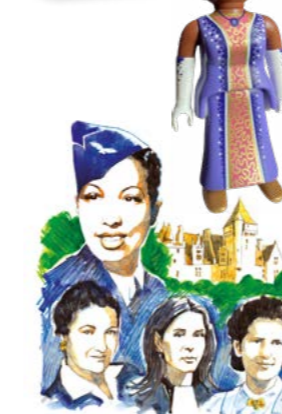
Dessin de José Correa®